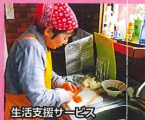
生活支援サービス