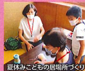
夏休みこどもの居場所づくり