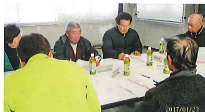
1月23日第2回配分金等基準検討委員会開催

配分金については、毎年専門委員会で見直しが行われ、改定が必要とされた場合は理事会の承認を得て翌年度から新しい基準が適用となります。平成29年度は就業会員の確保と安全対策として6～8月の屋外作業の配分金が値上げとなります。