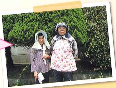
大莞小学校南側水辺公園