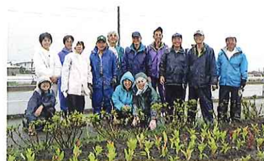
7月7・8日には、道の駅バイパス沿いの花壇に4種類合計2,700ポットの苗を植えました。

秋には昨年に続きパンジー苗づくりに取り掛かります。まだまだ試行錯誤の段階ではありますが、きれいなだけでなく長持ちする苗を地域の皆さんに届けられるよう、みんなで協力して取り組んでいきます。