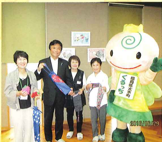
福岡県小川知事と記念撮影