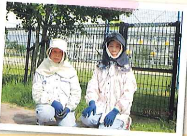
木佐木小南側水辺公園