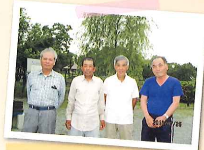
クリークの里石丸山公園