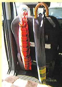
車の中も濡れません

この傘袋があれば、ビニール袋を使わずに濡れた傘でもお店に持ち込めます。入口の「傘立て」に置くことで忘れず使う！といううっかり屋さんには心強いエコグッズです。