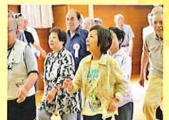
筋トレとストレッチ