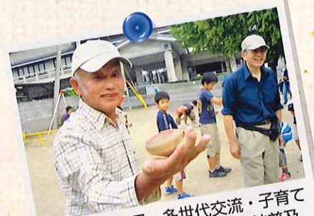
平成22年10月 多世代交流・子育て 応援委員会で福岡県和ごま競技普及 協会(太宰府市)の活動を見学しました。