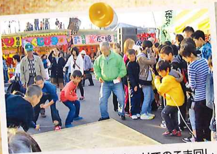
平成22年11月 大木まつりでのこま回し 大会。たくさん子どもたちが集まって くれました。