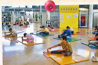
平成19年9月 農作業いちご講習会で“腰痛予防ストレッチ”。