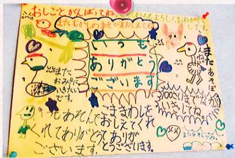
平成23年9月 月1回昔遊びを指導している 木佐木学童保育所の子どもたちから届けられた ありがとうの言葉。これが私たちの原動力です。