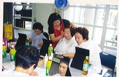
平成22年8月 女性会員の集いでメイクアップ講習。このあと、参加者は見違えるほど?きれいになりました。