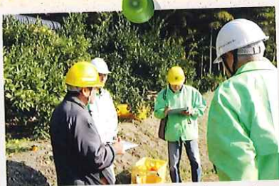
平成26年11月 月例の安全パトロールで みかん収穫作業の現場を訪問。安全対策員 の皆さんから就業会員さんへ聴き取りは、 体調の確認から始まります。