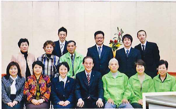
平成20年11月 4名の会員が模擬議員となり、「生ごみリサイクル」「農業支援」について町長に質問。緊張がとけた終了後には、石川町長、高山副町長(当時)を囲んで模擬議会メンバー全員笑顔で記念撮影。