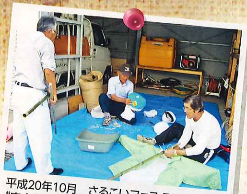
平成20年10月 さるこいフェスタで展示する “安全就業シルバーかかし”を製作