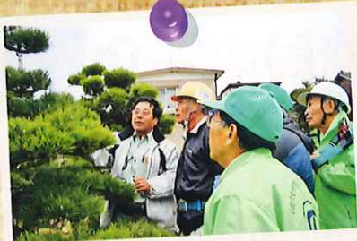
平成19年3月 植木剪定講習会。 ベテランの会員も技術向上のため毎年、 造園業の方から指導を受けています。