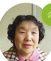
公益社団法人 大木町シルバー人材センター 大荒校区