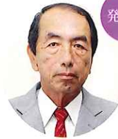
農事組合法人きのこの里 総務部長