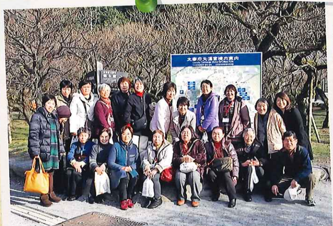
平成27年1月 今年の女性会員の集いは子育て支援の先進地、(公社)筑紫野市シルバー人材センターを訪問しました。帰りは太宰府天満宮でお参り&お茶をしながら作戦会議、「私たちもっと頑張らやんね」とやる気まんまん。