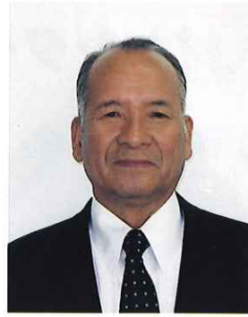
公益社団法人 大木町シルバー人材センター 理事長