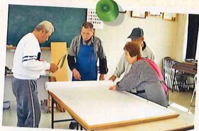
平成18年3月 大川市シルバー人材センターの会員さんを講師に招いての障子張り講習会