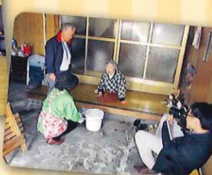
町より「高齢者等ごみ出しサポート事業」受託