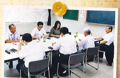
平成26年9月 大木町議会同文教厚生委員会との意見交換会では、委員会の皆様からエールをいただきました。