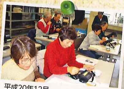
平成20年12月 水道メーター検針機器導入のための 機器操作研修会