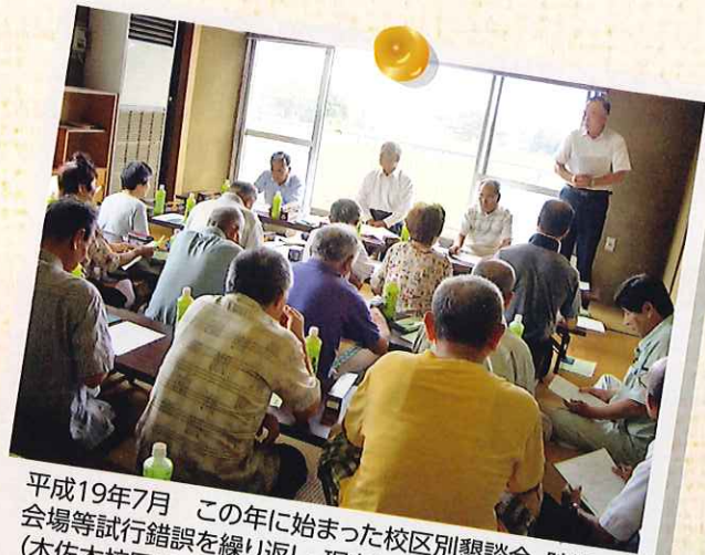
平成19年7月 この年に始まった校区别懇談会、時期や 会場等試行錯誤を繰り返して、現在は2月に校区コミセン (木佐木校区はシルバー2階)での開催になりました。