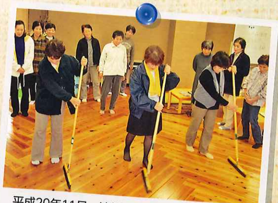
平成20年11月 清掃講習会。床の掃き方をチェック中。みんなに見守られて思わず緊張。