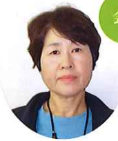
公益社団法人 大木町シルバー人材センター 大溝校区