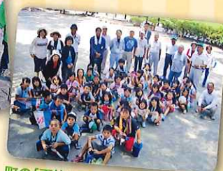
町の「夏休み子ども一日預かり事業」参加