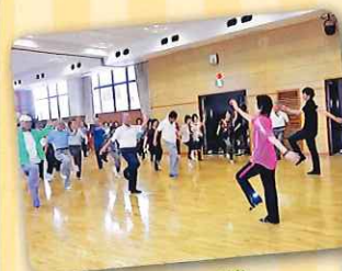
安全就業促進大会開催