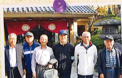
平成18年11月 大木町シルバー人材 センターになって初めての会員交流旅行は 日帰りで脇田温泉(宮若市)に行きました。