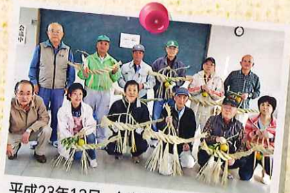
平成23年12月 毎年恒例のしめ縄づくり 指導者養成講座。今では受講生のほとんど が子ども向けミニしめ縄づくりの先生に なりました。