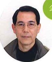
公益社団法人 大木町シルバー人材センター 木佐木校区