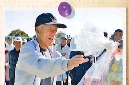
平成27年3月 町民交流グラウンドゴルフ大会。競技のあとの福引大会も盛り上がりました。