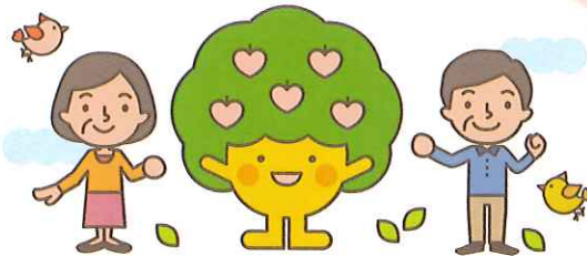
設立10周年を記念して誕生した大木町シルバー人材センターのイメージキャラクター“みのりちゃん”