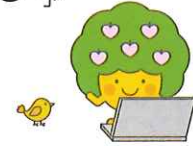
会員数(令和2年3月31日現在)