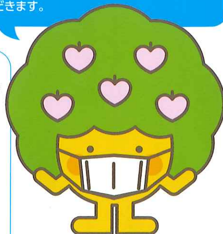
大木町シルバー人材センター イメージキャラクター みのりちゃん

●日時：8月24日(月)～28日(金) 10時00分～16時30分 ●場所：役場西別館大木町シルバー人材センター事務所