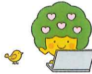
令和2年度地域別班別会員数