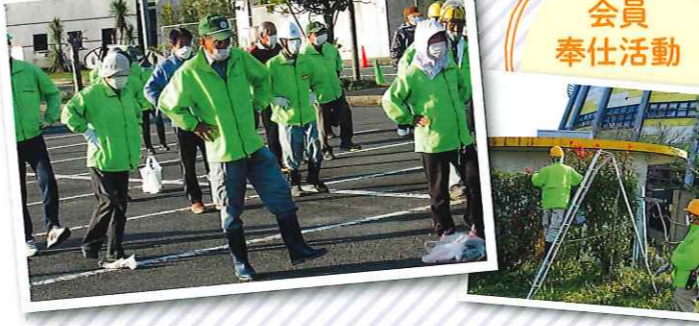
会員奉仕活動 イベントのたびに行っている「開眼片足立ち測定」。めざせ自己記録更新!