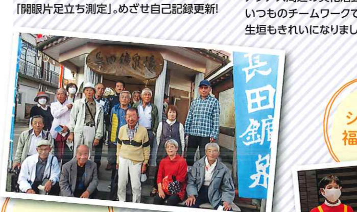
互助会旅行 互助会役員の方々のアイデアで計画される会員互助会交流事業。11月に行った船小屋での交流会に加え、2月にはボウリング大会を開催します。