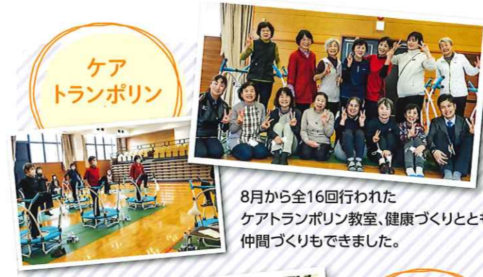
ケアトランポリン 8月から全16回行われたケアトランポリン教室、健康づくりとともに仲間づくりもできました。