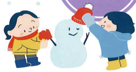
大溝保育園での「昔遊びの会」を終えて